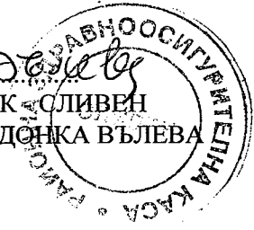
График за подписване на допълнителни споразумения към сключените с РЗОК – Сливен договори с изпълнители на болнична медицинска помощ и медико - диагностична дейност, в съответствие с обнародвания в ДВ бр.95 от 29.11.2022 г. Договор № РД-НС-01-4-15/23.11.2022 г. за изменение и допълнение на НРД за МД 2020 - 2022 г.